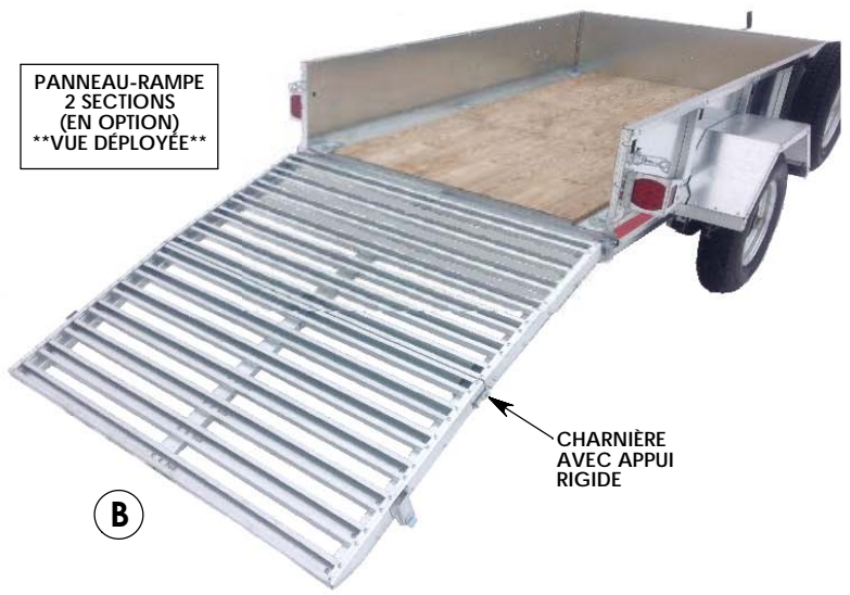
PANNEAU-RAMPE 2 SECTIONS (EN OPTION) **VUE DÉPLOYÉE**