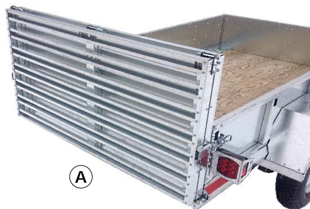
PANNEAU-RAMPE 2 SECTIONS (EN OPTION) **VUE REPLIÉE**